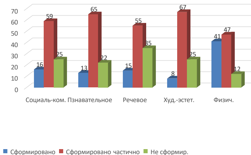
Результаты педагогической диагностики на начало 2021\2022 учебного года.

программный материал по образовательной области «Художественно-эстетическое развитие» усвоен детьми в основном на достаточном уровне.